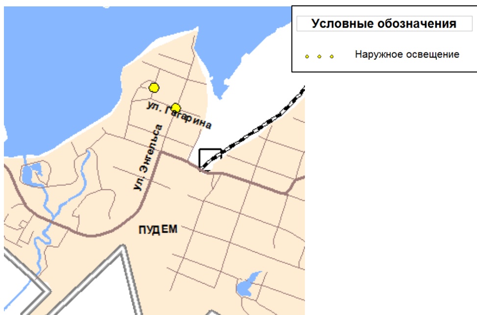
Рисунок 2.3.4.1. Мероприятия по организации дорожного движения